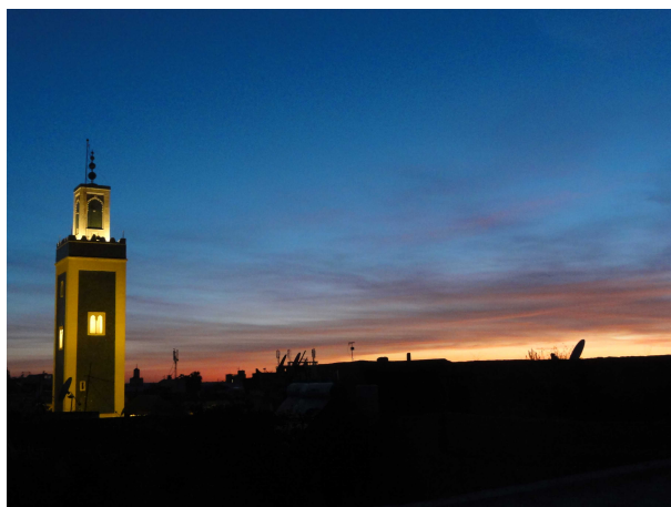
coucher de soleil depuis la terrasse du riad

Les deux stages cohabiteront dans le riad de Jean-Patrice et Fatima-Zahrae et se rencontreront par moments dans le travail, pour une semaine de ressourcement, d'éveil des sens et de l'imaginaire, au cœur d'une des plus belles villes du Maroc.